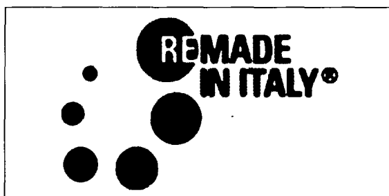
Una panoramica della Galleria Meravigli durante Remade in Italy 2006

Dal 3 al 2 aprile la Galleria Meravigli, nel cuore di Milano, ha ospitato la seconda edizione della manifestazione che promuove l'utilizzo di carta, plastica, alluminio, acciaio, vetro e altri materiali riciclati per la produzione di oggetti d'uso comune