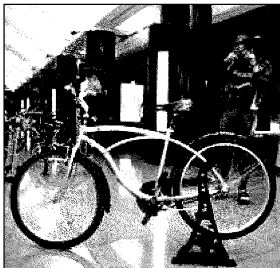
La "ricicletta" esposta al Museo dei Campionissimi

Novi Ligure. Il pubblico della grandi occasioni era presente, ieri mattina all'inaugurazione, della mostra "La bici che verrà", allestita al Museo dei Campionissimi, che potrà essere vista fino al prossimo 7 gennaio. Tra gli oltre cinquanta modelli in esposizione la vera novità è rappresentata dalla "ricicletta", la bicicletta realizzata interamente con materiale riciclato.