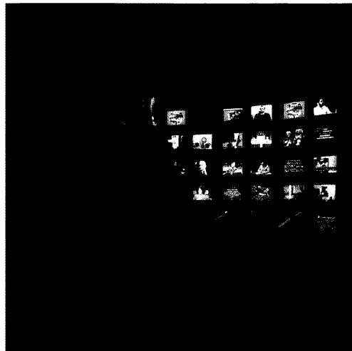
Una vera opportunità di lavoro per i giovani e di visibilità per le imprese

e aziende. A novembre la giuria decreterà i vincitori tra i giovani registi, mentre le aziende potranno disporre pienamente dell'elaborato realizzato. Per seguire tutte le novità consultate il sito www.movieco.it e il blog blog.movieco.it .